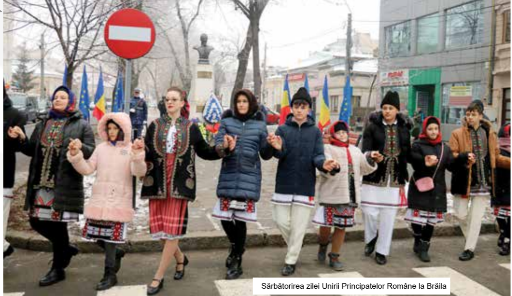
Sărbătorirea zilei Unirii Principatelor Române la Brăila