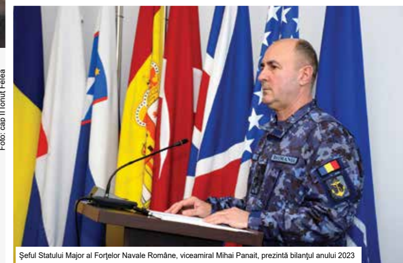
Șeful Statului Major al Forțelor Navale Române, viceamiral Mihai Panait, prezintă bilanțul anului 2023

Operația UE EUNAVFOR MED IRINI, ca parte a angajamentelor asumate de România în cadrul Alianței și Uniunii. Totodată, au fost desfășurate activități de modernizare, atât la nave din Flotă și Flotila Fluvială, cât și la toate cele patru instituții militare de învățământ și formare profesională din Constanța și Mangalia, investiția în educație reprezentând o ancoră de stabilitate în sistemul național de învățământ, precum și o investiție importantă pentru viitorul Forțelor Navale Române. ”, a spus viceamiralul Mihai Panait la începutul expunerii sale.