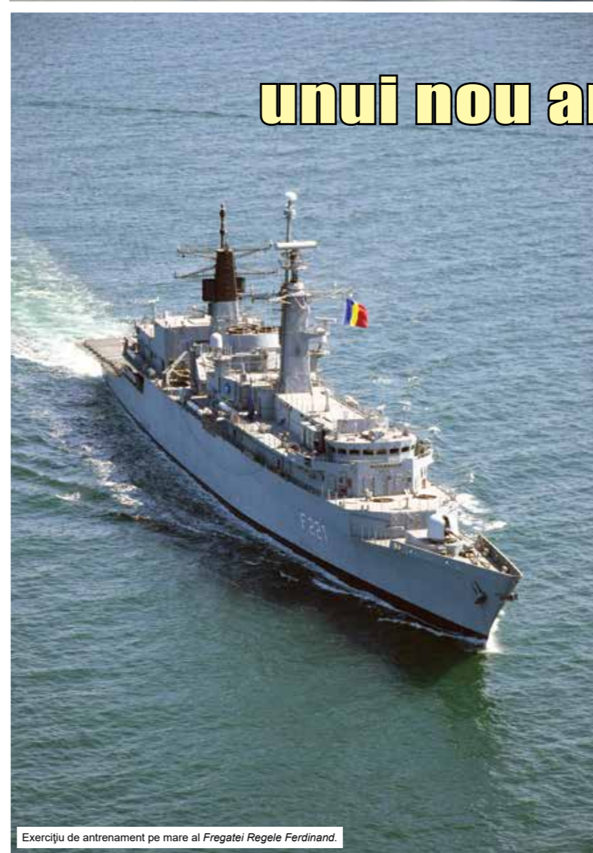
Exercițiu de antrenament pe mare al Fregatei Regele Ferdinand.