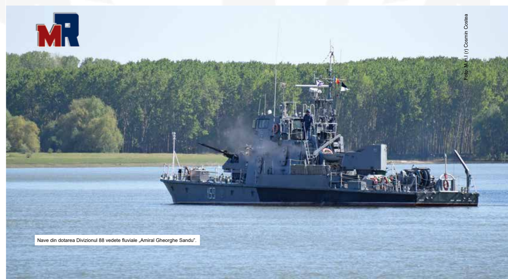
Nave din dotarea Divizionul 88 vedete fluviale „Amiral Gheorghe Sandu”.