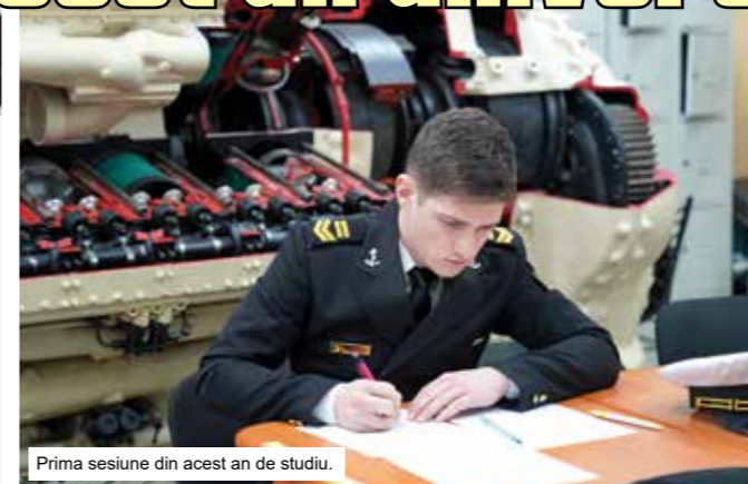
Prima sesiune din acest an de studiu.