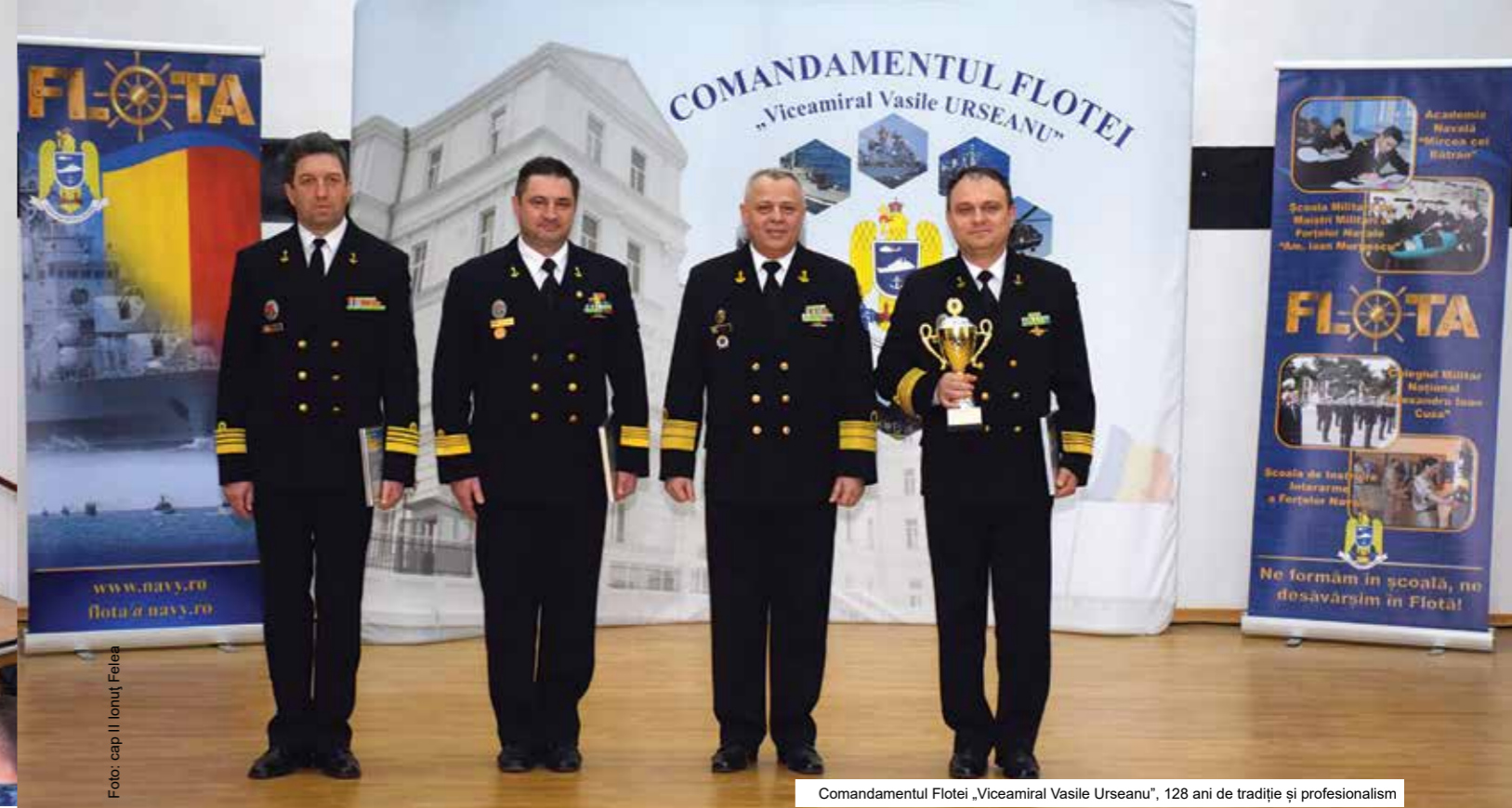
Comandamentul Flotei „Viceamiral Vasile Urseanu”, 128 ani de tradiție și profesionalism

Actuala structură a Flotei dispune, la Constanța și la Mangalia, de un pachet de capabilități de luptă și de apărare, format din fregate, corvete, nave purtătoare de rachete, nave minare-deminare, nave de sprijin pentru acțiuni maritime, remorchere maritime, rachete de coastă și elicoptere cu care este în măsură să desfășoare acțiuni militare, pe timp de pace sau în caz de agresiune armată, în zona definită de apele maritime interioare,