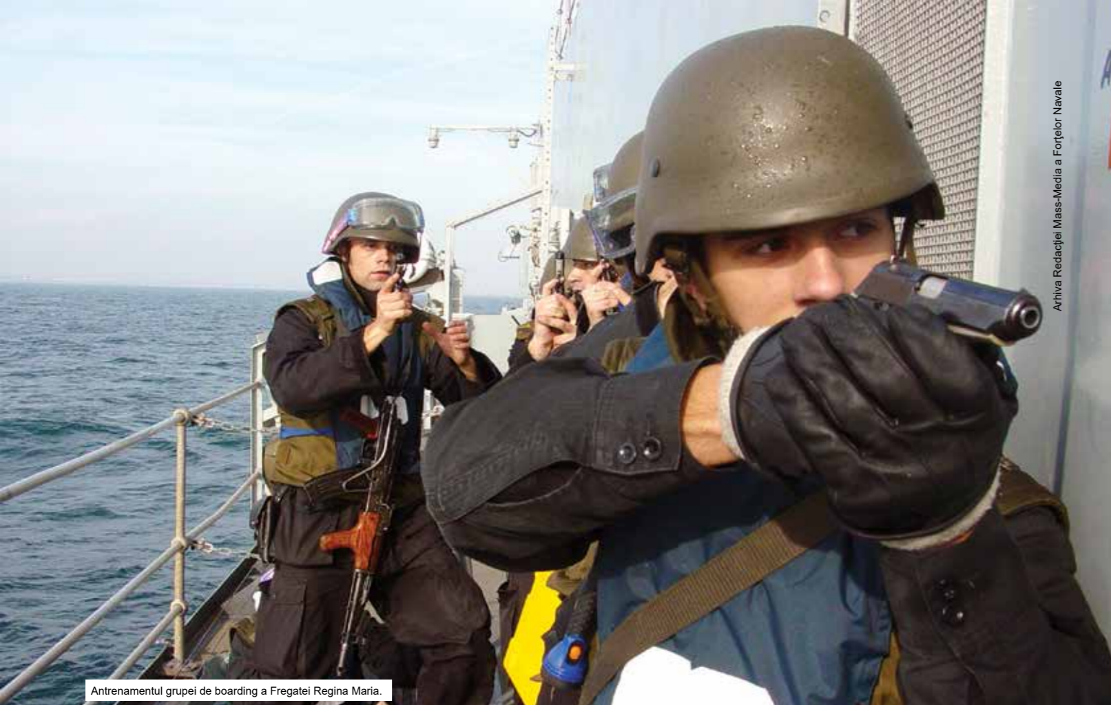
Antrenamentul grupe de boarding a Fregatei Regina Maria.