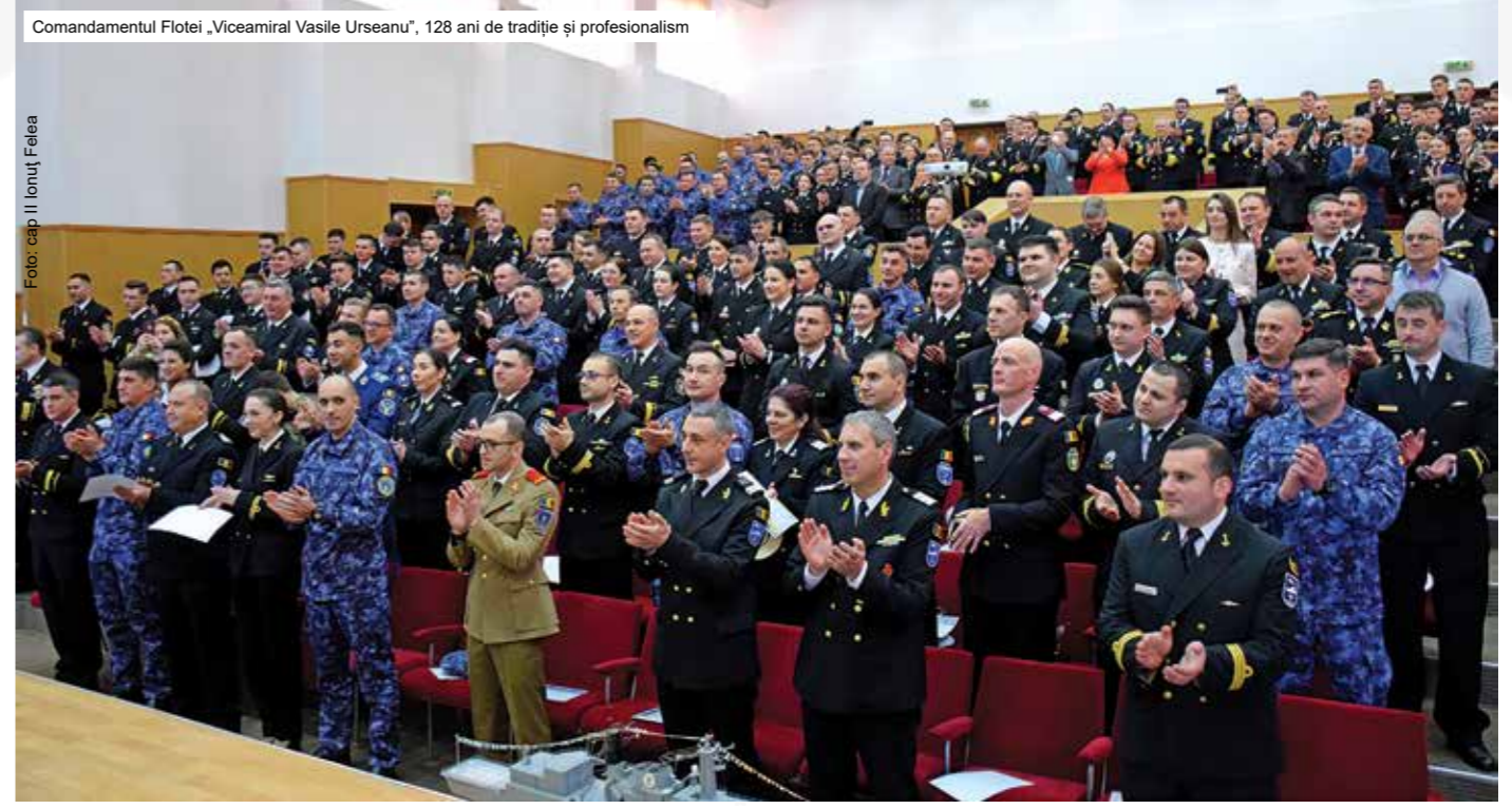
Comandamentul Flotei „Viceamiral Vasile Urseanu”, 128 ani de tradiție și profesionalism