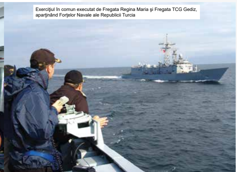
Exercițiul în comun executat de Fregata Regina Maria și Fregata TCG Gediz, aparținând Forțelor Navale ale Republicii Turcia