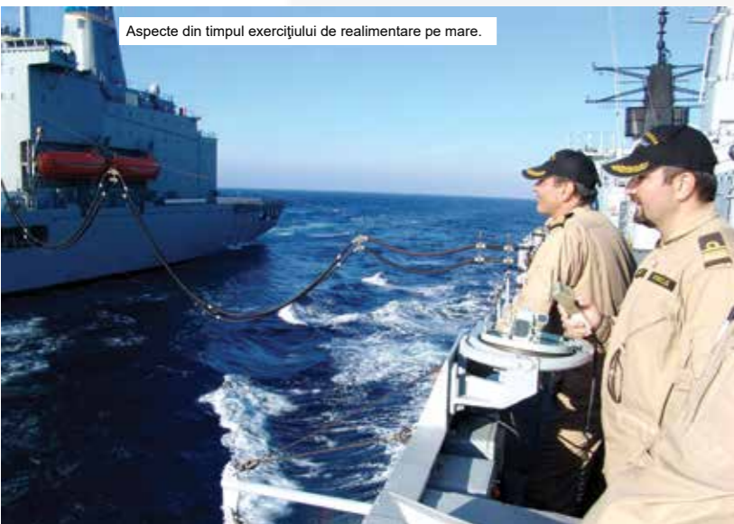
Aspecte din timpul exercițiului de realimentare pe mare.

După ce 137 de zile a acționat pentru asigurarea capacității de reacție imediată la nivelul NATO în Marea Mediterană, Marea Egee și Marea Neagră, puitorul de mine și plase Viceamiral Constantin Bălescu , nava comandant a grupării navale