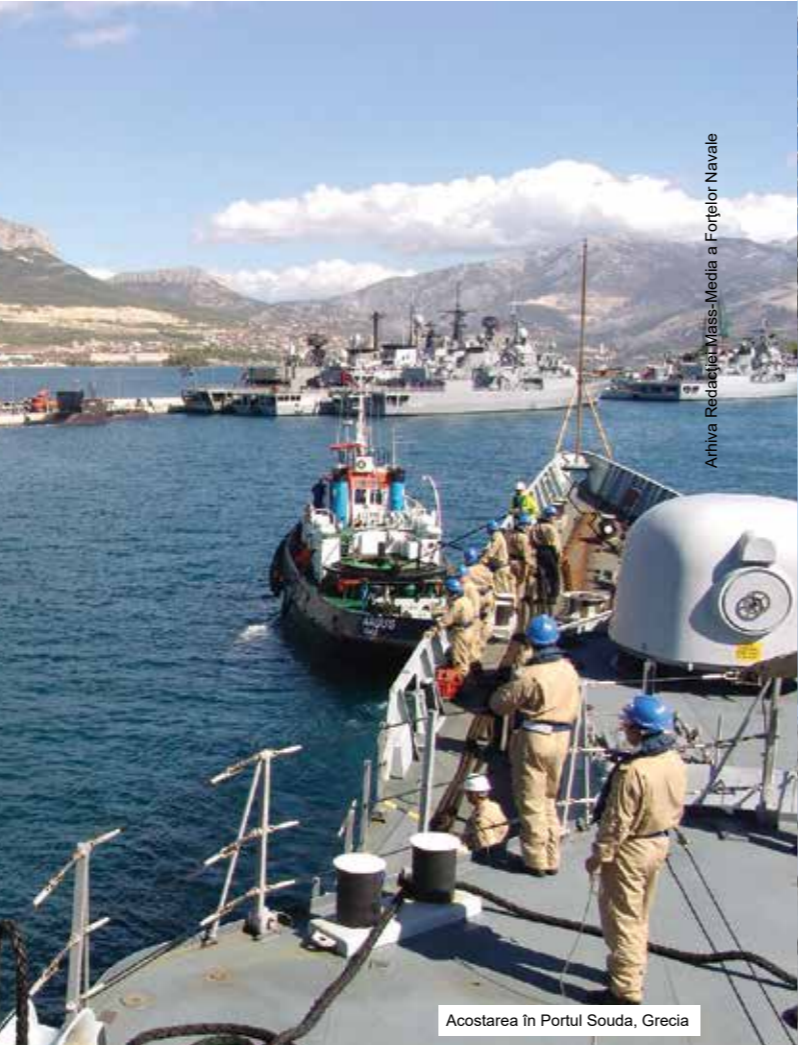
Acostarea în Portul Souda, Grecia

Pe timpul desfășurării misiunii, nava militară a acostat în portul militar Souda din Insula Creta, unde militarii români au participat la centrul de pregătire NMIOTC (NATO Maritime Interdiction Operational Training Centre), la un modul de instruire specifică misiunii, precum și în portul militar Alexandria din Egipt, pentru refacerea capacității de luptă.