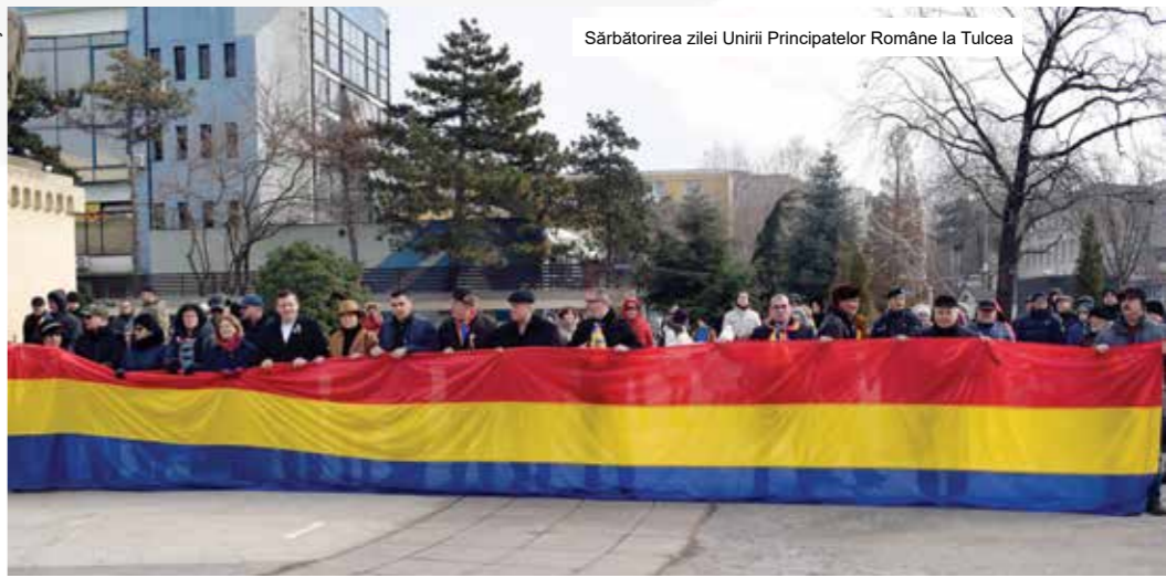
Sărbătorirea zilei Unirii Principatelor Române la Tulcea