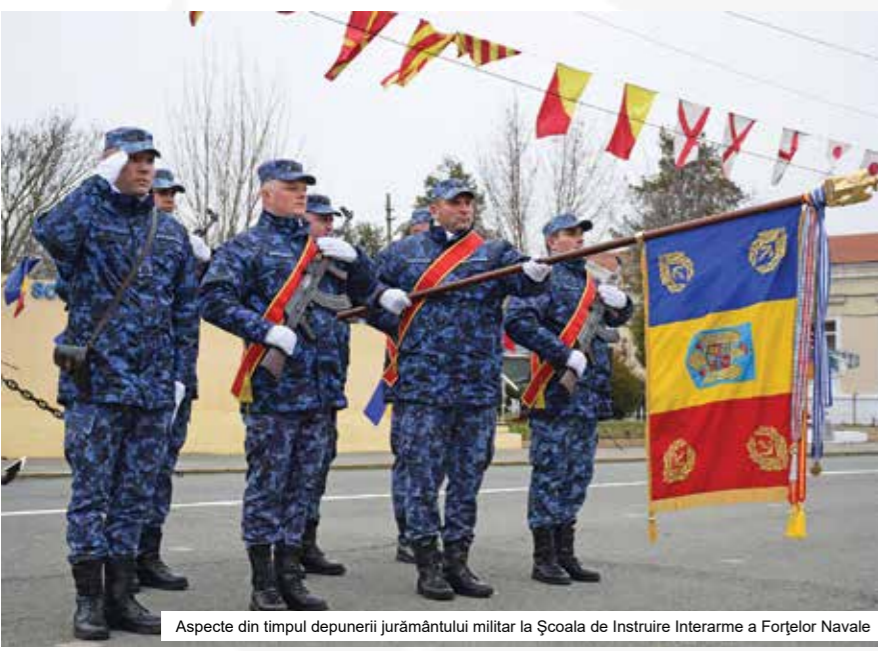
Aspecte din timpul depunerii jurământului militar la Școala de Instruire Interarme a Forțelor Navale