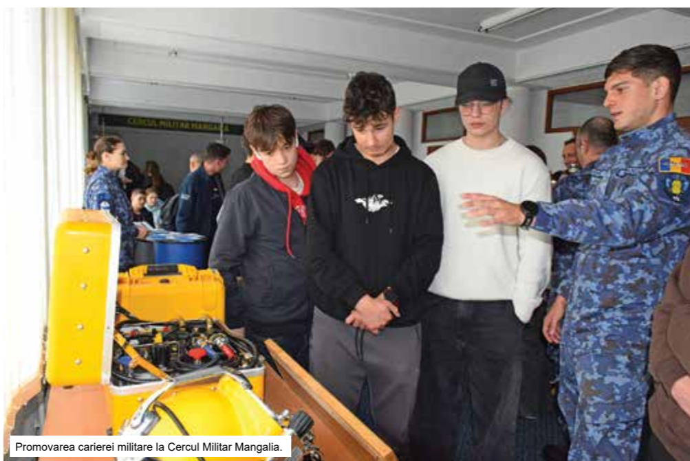
Promovarea carierei militare la Cercul Militar Mangalia.