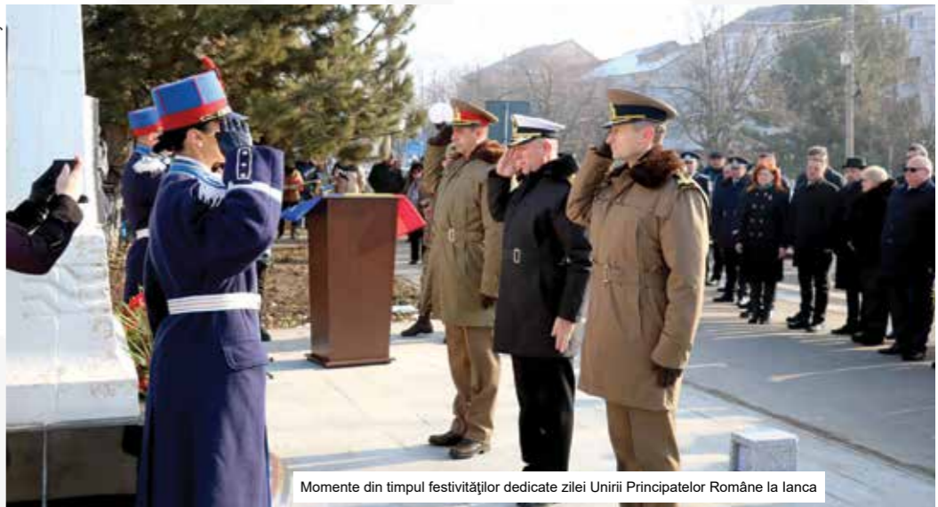
Momente din timpul festivităților dedicate zilei Unirii Principatelor Române la Ianca