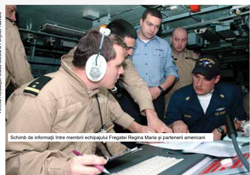
Schimb de informații între membrii echipajului Fregatei Regina Maria și partenerii americani

Arhiva Redacției Mass-Media a Forțelor Navale