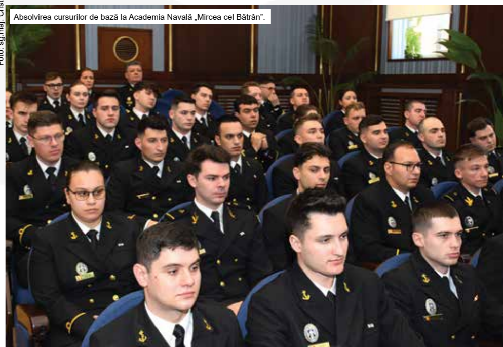
Absolvirea cursurilor de bază la Academia Navală „Mircea cel Bătrân”.