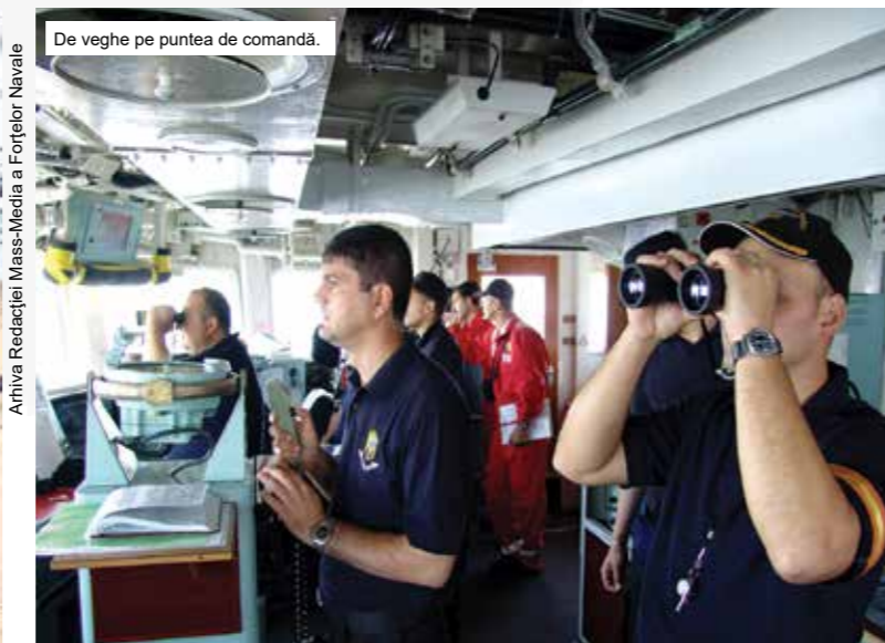
De veghe pe puntea de comandă.