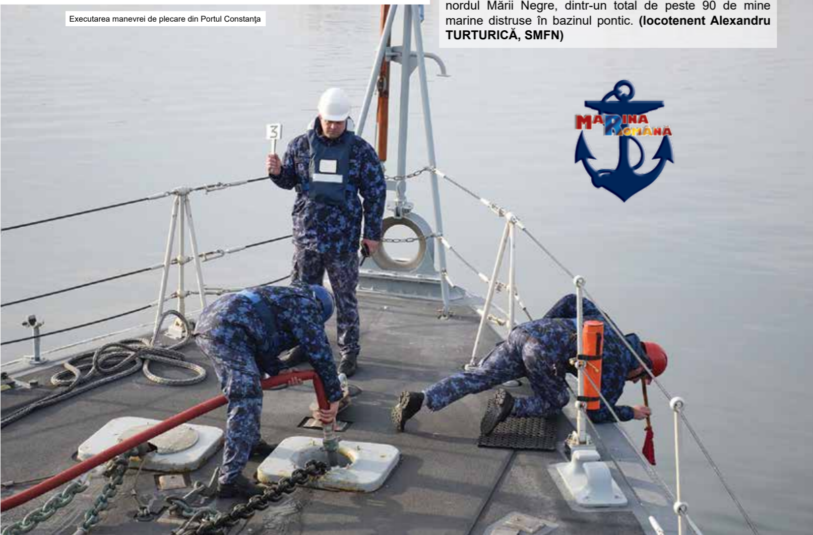
Executarea manevrei de plecare din Portul Constanța