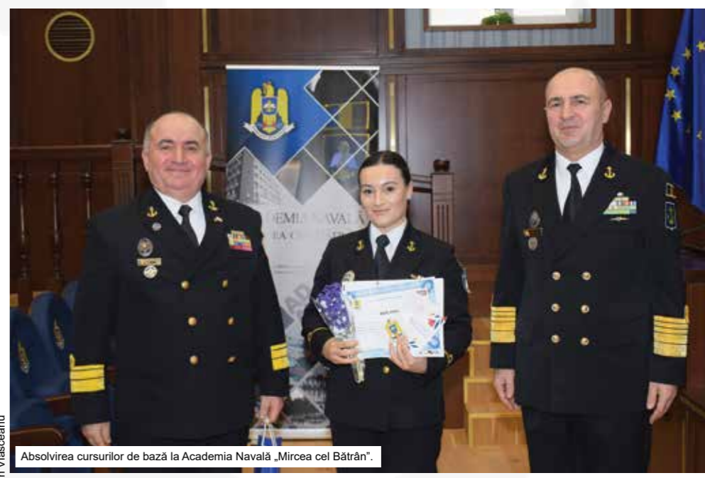
Absolvirea cursurilor de bază la Academia Navală „Mircea cel Bătrân”.