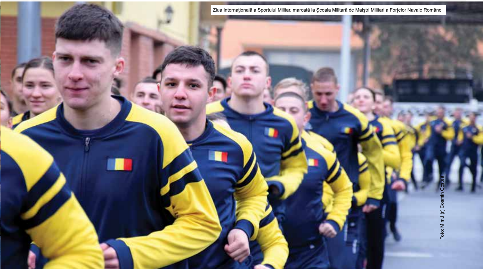
Ziua Internațională a Sportului Militar, marcată la Școala Militară de Maiștri Militari a Forțelor Navale Române