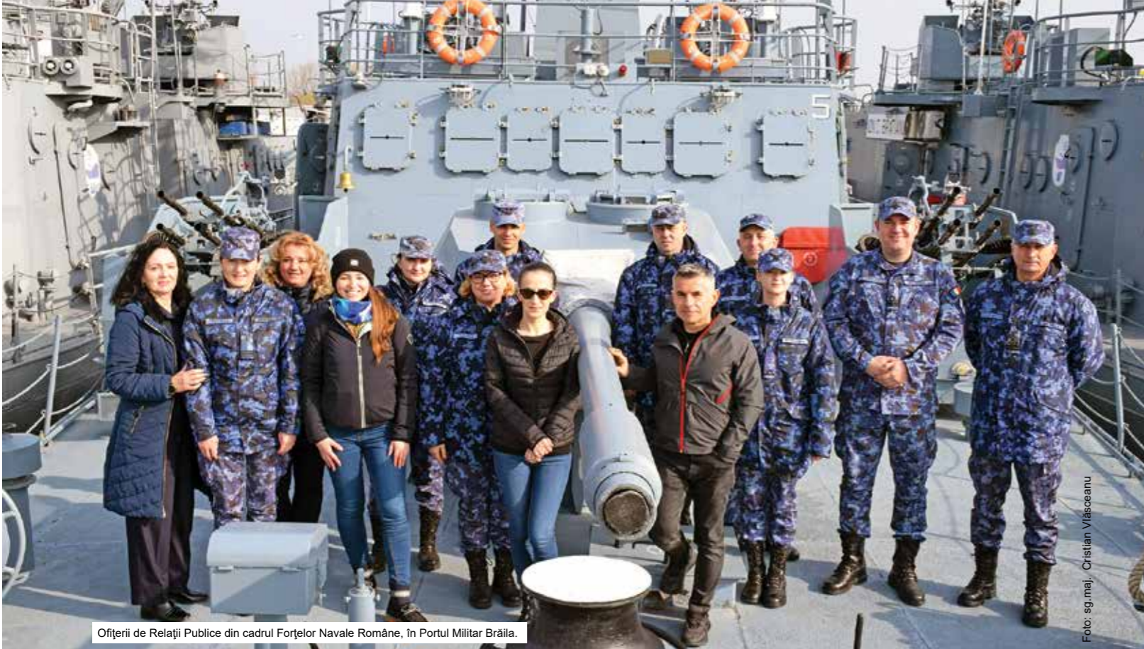
Ofiterii de Relații Publice din cadrul Forțelor Navale Române, în Portul Militar Brăila.