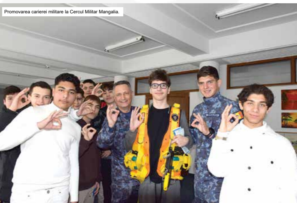
Promovarea carierei militare la Cercul Militar Mangalia.