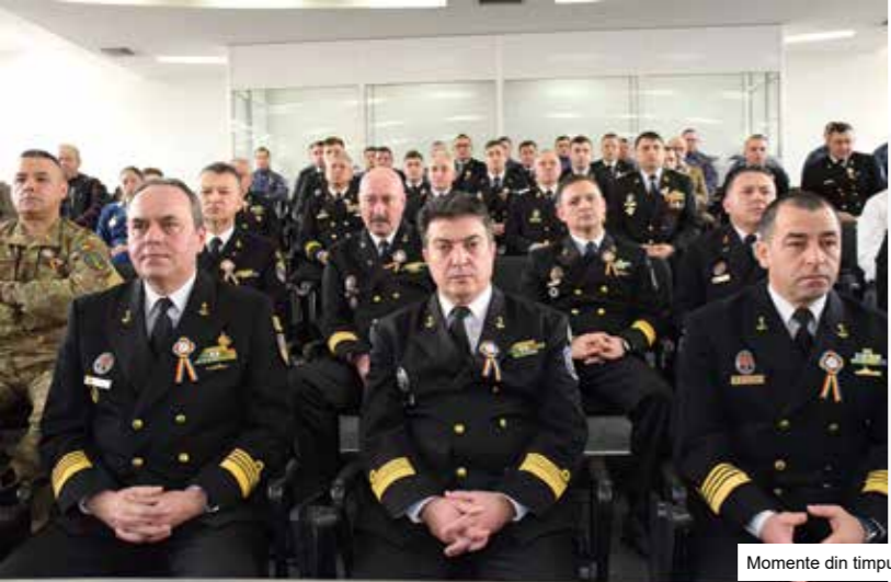
Momente din timpul festivității aniversare